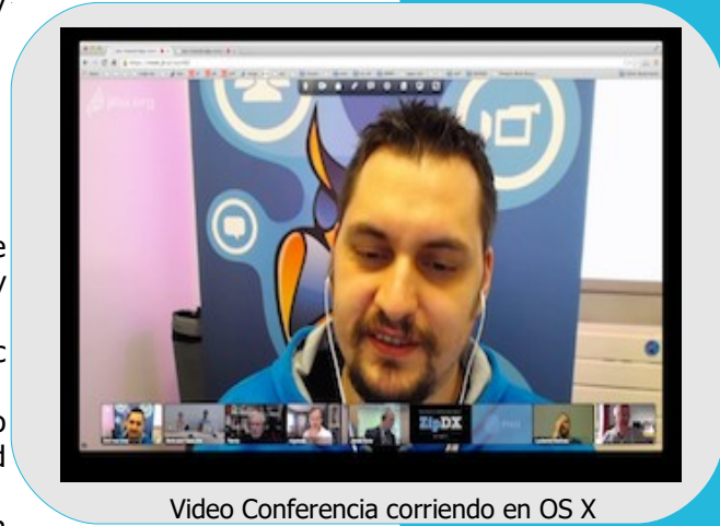
Video Conferencia corriendo en OS X